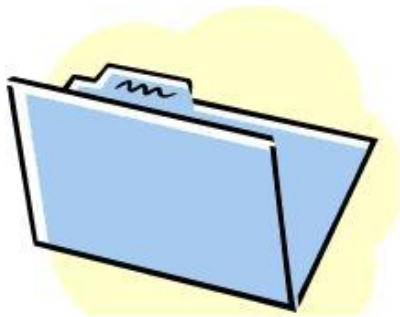
TRAMITACIÓN DEL EXPEDIENTE

PERSONALMENTE en la Unidad de Transparencia del INPRFM, previa acreditación de titularidad de los datos personales o de representación del titular. De lunes a viernes en un horario de 9:00 am a 3:00 pm.